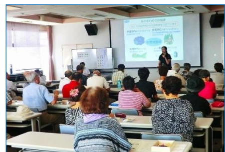
放射線と健康影響学習