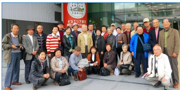
日帰りバスツアー NHK 放送博物館