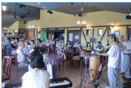
楽しく合唱 歌声喫茶