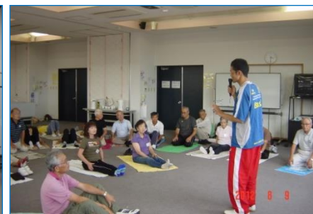
シニア体力増進学習